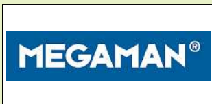
Halle 4.1, Stand H70