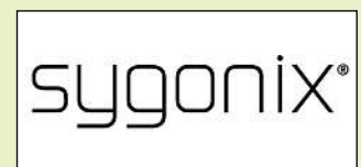
Halle 11.1, Stand C25