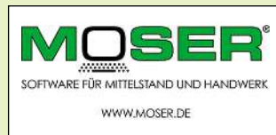
Halle 9, Stand E64