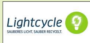
Halle 9.1, Stand D28