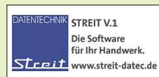
Halle 8.0, Stand C92