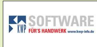
Halle 8.0, Stand J51